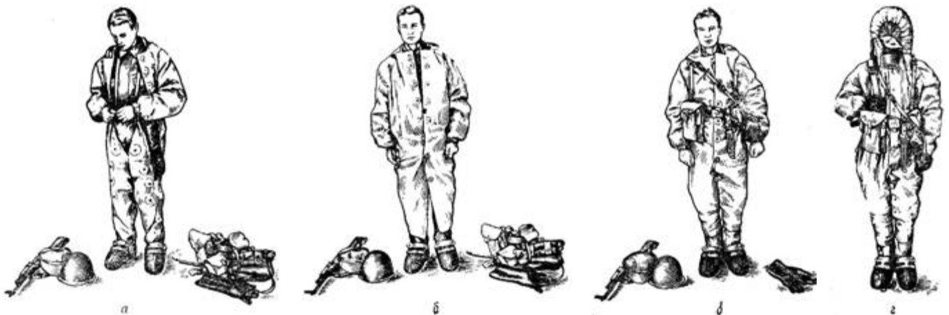
Порядок надевания общевойскового защитного комплекта в виде комбинезона