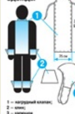
Элементы герметизации одежды