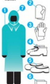
Простейшие средства защиты кожи