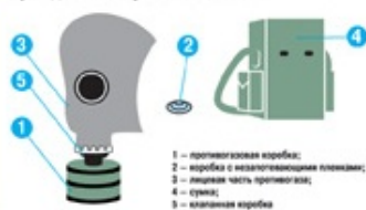
Гражданский противогаз ГП-5